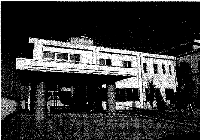
養護老人ホームひとみ園

その増築園舎には盲人用の映画館と盲人用のカラオケ喫茶が併設されていますので入園者の教養娯楽活動が大きく前進します。それに、現在我が国には盲老人ホームが50箇所ありますが、120名定員のひとみ園は定員規模において我が国最大の盲老人ホームとなります。